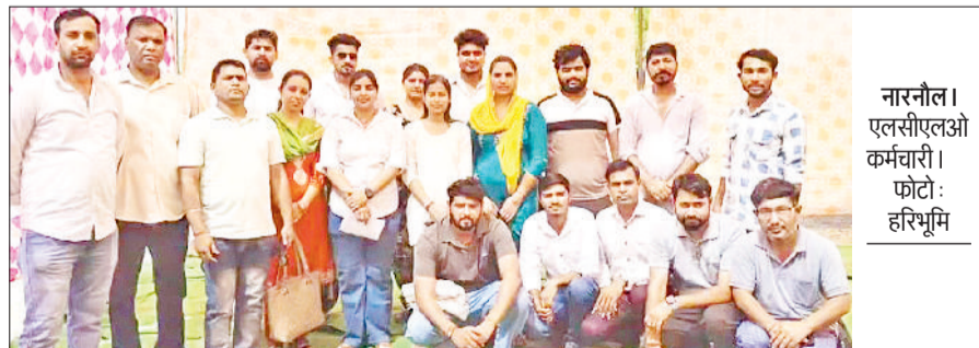
नारनौल। एलसीएलओ कर्मचारी।