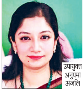
उपायुक्त अनुपमा अंजलि

मकानों का सूचीकरण और मकानों की गणना का कार्य किया जा रहा है। उपायुक्त ने अपील की है कि जनगणना के लिए आने वाले कर्मचारियों को सही जानकारी दें और निडर होकर इस प्रक्रिया का हिस्सा बनें। उन्होंने स्पष्ट किया कि जनगणना की जिम्मेदारी केवल सरकारी कर्मचारियों की ही नहीं बल्कि हर प्रभुद्ध नागरिक की भी है।