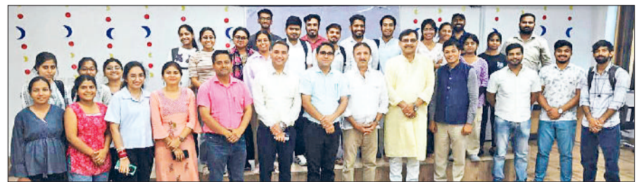
महेन्द्रगढ़। कार्यक्रम में उपस्थित अतिथि।