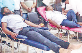
नारनौल। शिविर में रक्तदान करते हुए।