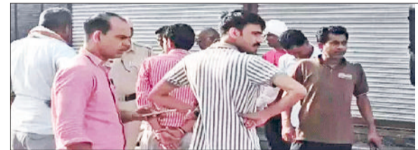
नारनौल। मौके पर एकत्रित हुई लोगों की भीड़।