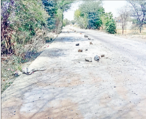
नारनौल। मरम्मत के लिए सड़क पर डाला गया विशेष लेप।

मंजूरी दी गई थी और इसके लिए 22 करोड़ रुपये का बजट स्वीकृत किया गया था। इसके अलावा धौलेड़ा क्षेत्र में बाइपास निर्माण के लिए चार करोड़ रुपये जिला माइनिंग फंड से अलग से मंजूर किए गए थे। सरकार ने इस सड़क को सीमेंट कंक्रीट (सीसी) के रूप में बनाने का निर्णय लिया था, ताकि क्षेत्र में चल रहे खनन कार्य और भारी वाहनों के दबाव को सहन किया जा सके। दरअसल, धौलेड़ा क्षेत्र माइनिंग जोन के रूप में जाना जाता है, जहां बड़ी संख्या में क्रेशर जोन संचालित हैं और खनन से भरे ओवरलोड डंपर निरन्तर लगातार आवाजाही करते हैं। पहले बनी तारकोल की सड़कें इन भारी वाहनों के कारण जल्दी टूट जाती थी, इसलिए सीसी