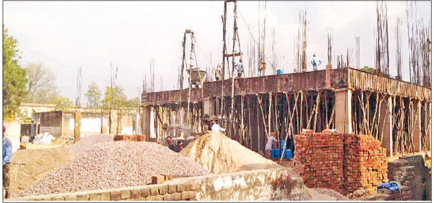
महेन्द्रगढ़। नया के नए भवन में लैंटर लगाने का कार्य करते श्रमिक।

करीब 4.36 करोड़ रुपये की लागत से करवाया जा रहा है निर्माण, आधुनिक सुविधाओं से होगा लैस