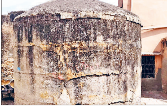
नांगल चौधरी। पानी की टंकी।