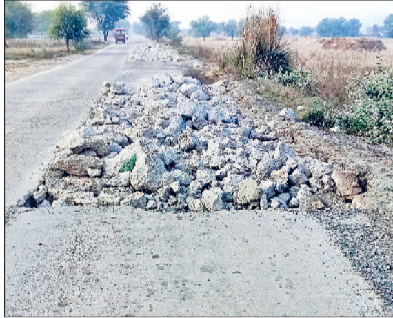
नारनौल। पुनर्निर्माण के लिए तोड़ी गई क्षतिग्रस्त सड़क।

करोड़ों रुपये खर्च कर बनाई गई नारनौल-धौलेड़ा-मेघोत सड़क की एक साल के भीतर ही अपनी गुणवत्ता की पोल खुलने लगी है। करीब 15.150 किलोमीटर लंबी और सात मीटर चौड़ी इस सड़क का निर्माण पीडब्ल्यूडी विभाग की देखरेख में धर्मपाल एंड कंपनी द्वारा किया गया था, लेकिन हालत यह है कि जहां एक ओर सड़क का निर्माण कार्य अभी आगे चल रहा है, वहीं पीछे से बनी सड़क कई जगहों पर टूटकर बिखर चुकी है। यह सड़क नारनौल की अनाज मंडी के पास से शुरू होकर मेघोत के आगे निजामपुर रोड से जुड़ती है और इसके बीच लगभग एक दर्जन गांव पड़ते हैं। ऐसे में यह मार्ग क्षेत्र के लोगों के लिए बेहद महत्वपूर्ण माना जाता है। बावजूद इसके, सड़क की खराब हालत ने लोगों को निराश कर दिया है। बता दें कि करीब तीन साल पहले तत्कालीन मुख्यमंत्री मनोहर लाल द्वारा इस सड़क के निर्माण को